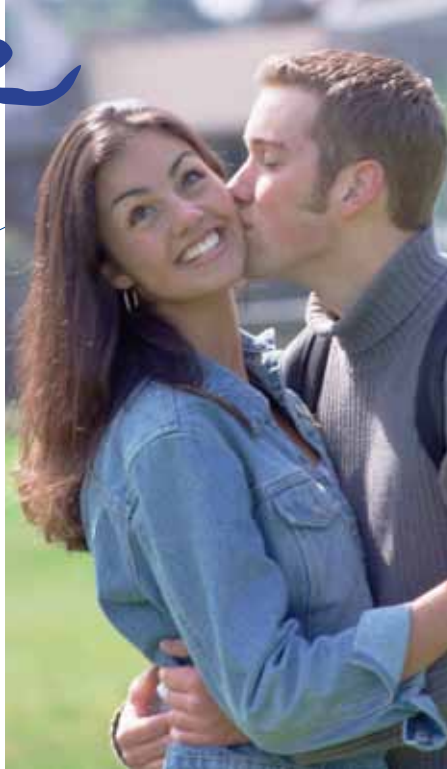
○ Dubbel taboe: een vriendje en ook nog van het verkeerde geloof.

De westerse hulpverlening is nog onvoldoende toegesneden op de problematiek van Turkse en Marokkaanse meisjes; hen wordt dezelfde hulp geboden als autochtone meiden en vrouwen. Het gangbare idee is om vanuit een individualistische cultuurgedachte hulp te bieden. Te vaak nog wordt ervan uit-