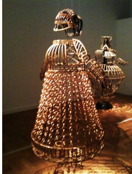
Shakuntala Kulkarni, Of bodies, armour and cages.

Een goede introductie op het werk dat op de tentoonstelling Female Power te zien is (nog tot en met 20 mei in het MMKA).